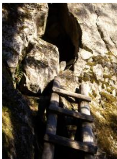
Lassilan linnavuori Ruokolahti

Määritelmä: Retkikohteilla tässä tarkoitetaan alueita tai pistemäisiä nähtävyyksiä, joissa kohteen vetovoima syntyy luonnonympäristön tai maiseman, historiallisen nähtävyyden tms. perusteella, ja joiden yhteyteen on rakennettu palveluja retkeilijöille. Näille kohteille pääsee autolla usein melko lähelle, jolloin niihin ei välttämättä liity patikointia. Retkikohteet voivat myös olla jonkin retkeily- tai pyöräilyreitillä taikka latureitin varrella levähdyspaikkoina. Retkeilyreittien laavut voivat toimia vastaavasti retkikohteena. Retkikohteita voivat olla myös luonnonsuojelukohteet, muinaismuistot ja lintujen tarkkailupaikat. Retkikohteita ovat myös matkailupalvelut sekä muut Etelä-Karjalan palvelukohteet reittien varrella ja lähituntumassa. Erityisesti mainittakoon Ukonniemen ja Imatran kylpylän palvelut sekä Rauhan alueen tulevat matkailupalvelualueet sekä Salpalinjan kohteet ja Salpa-reitistön kehittäminen.