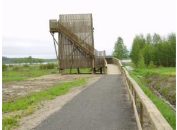
Tarassiinlahden lintutornin alatasanteelle pääsee pyörätuolilla

Etelä-Karjalan retkeilypalveluiden rakentamisessa on eräissä paikoin otettu huomioon liikuntaesteiset. Taulukossa mainitut kohteet sisältyvät myös edellisiin luetteloihin. Esteettömällä retkipolulla ei saa olla jyrkkiä nousuja ja laskuja taikka portaita.