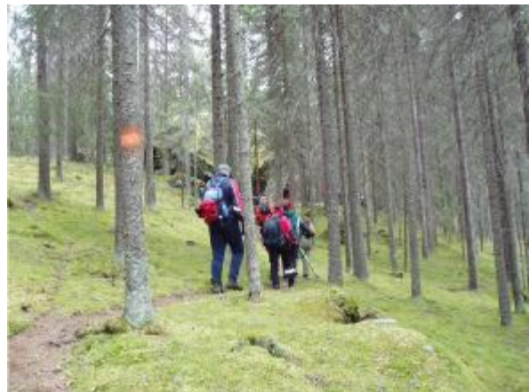
E10, Rajojen reitti

Suur-Saimaan retkisatamat ja virkistysalueet pääsivät vuoden 2009 retkikohdekilpailun 10 finalistin loppukilpailujoukkoon. Lisäksi Saimaa on myös ehdolla maailman seitsemäksi ihmeeksi. Saimaa on ainoa suomalaisehdokas kaikkiaan 261 kohteesta yhteensä 222 maasta. Uudet luonnonsuojelukohteet valitaan nettiäänestyksellä, johon odotetaan osallistuvan yli miljardi ihmistä. Äänestys päättyy heinäkuun 7. päivänä 2009. Sen järjestää kotisivuillaan hyötyä tavoittelematon New7Wonders. Voittajat selviävät vuoteen 2011 mennessä.