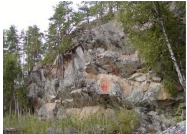
Kolmiköytisen kalliomaalaukset Ruokolahdella.

lut vuosisatojen ajan valtakunnan raja-alueita rajalinjan sijainnin vaihdellessa maakunnan alueella. Vanhoja rajamerkkejä on maastossa jo vuodelta 1722, erityinen kulttuurivaihe on myös venäläisen armeijan linnoitukset ja kanavat 1790-luvulta. Myöhempiä rajahistorian todisteina ovat näkyvissä ensimmäisen ja toisen maailmansotien aikaiset taistelukaivannot, korsut, tykkijalustat ja kiviasteet. Nykyinen valtakunnan raja ja läheiset yhteydet Venäjän puolelle tuovat oman vaikutuksensa alueen nykykulttuuriin. Etelä-Karjalan liiton v. 2007–2008 laatimassa Etelä-Karjalan maisema- ja kulttuurialueselvityksessä on kattavasti esitetty maakunnan tärkeimpiä kulttuuri- ja maisemakohteita.