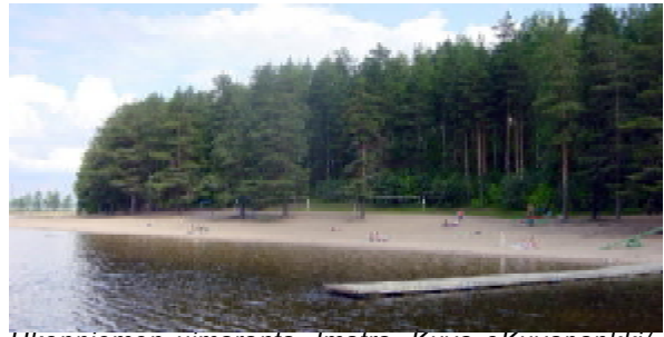
Ukonniemen uimaranta, Imatra.

Vesistörikkaassa maakunnassa on paljon uimarantoja Saimaan ja pienempien järvien rannoilla sekä Vuoksella. Joutsenossa on uimapaikkoja myös tekolammilla. Viralliset uimarannat ovat kuntien hoidossa, ja niiden vedenlaatua seurataan lämpimän veden ajan. Lisäksi on muita yleisiä ranta-alueita ja valvomattomia uimarantoja.