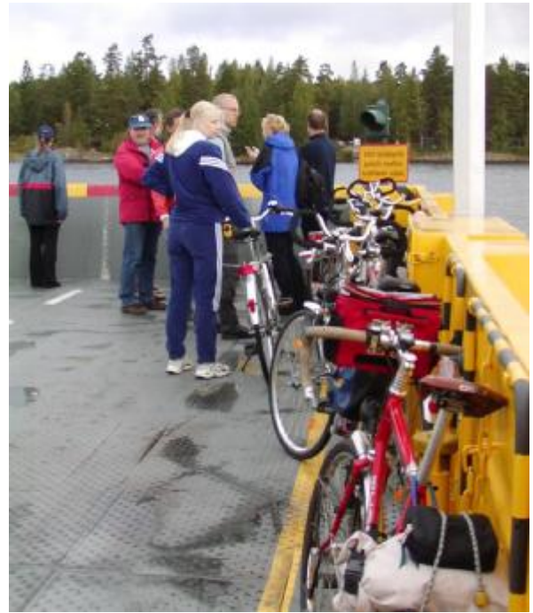
Pyöräilijät Kyläniemen lossilla.

Maakunnan sisällä markkinoidaan yhtä pyöräilyreittiä, eteläisen Suur-Saimaan kiertävää Kyläniemen kautta kulkevaa Saimaan pyöräilyreittiä. Etelä-Karjalan retkeilyreittiprojekti herätti henkiin 1990-luvulla tuotetun Saimaan pyöräilyreitit, joka kiertää Lappeenrannasta Joutsenon, Imatran ja Ruokolahden kautta Kyläniemeen ja sieltä venekuljetuksella Taipalsaarelle. Tällä reitillä on jäljellä vanhoja opastusmerkintöjä, mutta ne ovat puutteelliset. Mahdollisuuksia olisi useille muillekin pyöräreiteille.