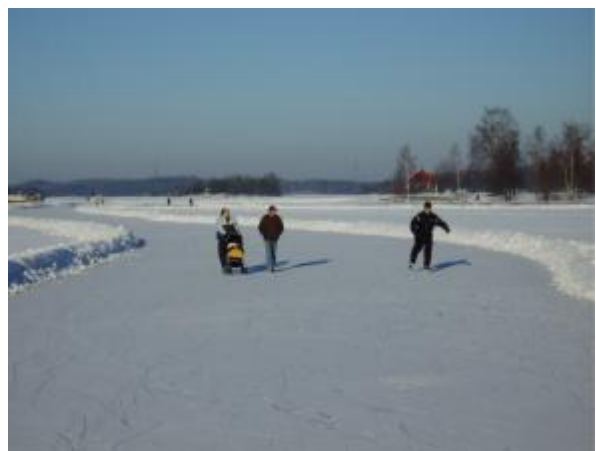
Lappeenrannan kaupunginlahden luistelurata ulottuu Karhusaareen asti