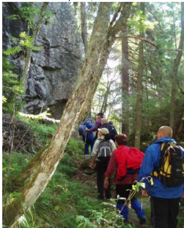
Maakuntaretki Pöröpolulla, Parikkalassa.

Luontopolkuja on toteutettu myös yksityishenkilöiden toimesta, kuten Hukkavuoren polku (Tornatorin maalla) ja Niinimäen luontopolku Joutsenossa nyky. Lappeenrannassa. Tiurunien luontopolkua pitää Etelä-Karjalan allergia- ja ympäristöinstituutti.