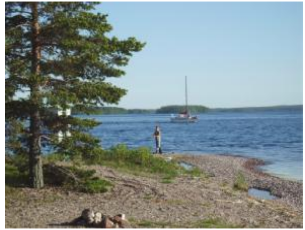
Saimaa ja pienemmät järvialueet sekä laajat talousmetsäalueet Salpausselällä ja niiden ympäristössä tarjoavat monipuoliset retkeily- ja virkistysmahdollisuudet.

Geopoliittisen sijainnin vuoksi Etelä-Karjala on ol-