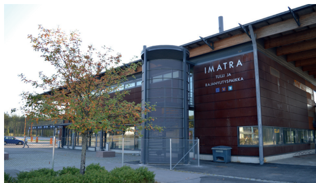
МАПП Иматра

Улучшенная ж/д связь позволяет перенести часть автомобильных грузов на железные дороги, что снизит транспортных выбросов.